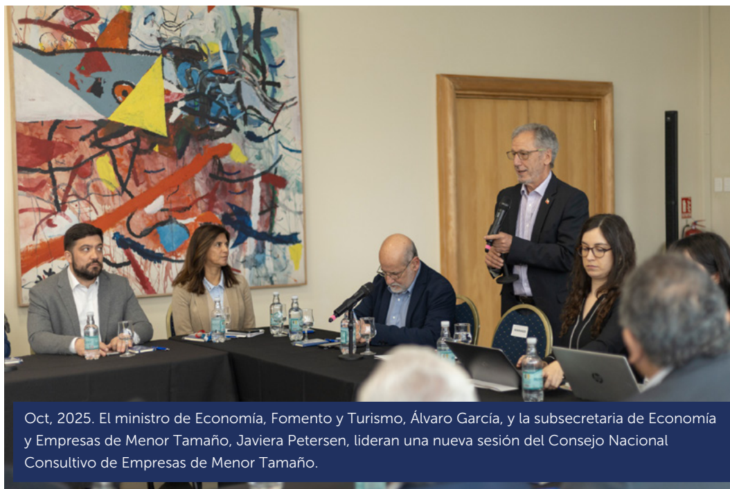
Oct, 2025. El ministro de Economía, Fomento y Turismo, Álvaro García, y la subsecretaria de Economía y Empresas de Menor Tamaño, Javiera Petersen, lideran una nueva sesión del Consejo Nacional Consultivo de Empresas de Menor Tamaño.

Durante el periodo 2022 a 2026, el programa “Pyme Ágil” incorporó a 72 municipios 7 , totalizando 80 comunas con convenio, de las cuales alrededor de 60 se encuentran en operación total en la plataforma, lo que se tradujo en la solicitud de más de 2.800 patentes comerciales de forma completamente online.