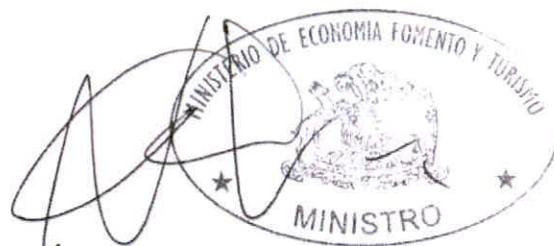
NICOLÁS GRAU VELOSO MINISTRO DE ECONOMÍA, FOMENTO Y TURISMO

ANÓTESE, COMUNÍQUESE, PUBLÍQUESE EN EXTRACTO EN EL DIARIO OFICIAL Y A TEXTO ÍNTEGRO EN LOS SITIOS DE DOMINIO ELECTRÓNICO DE LA SUBSECRETARÍA DE PESCA Y ACUICULTURA Y DEL SERVICIO NACIONAL DE PESCA Y ACUICULTURA, REGÍSTRESE Y ARCHÍVESE