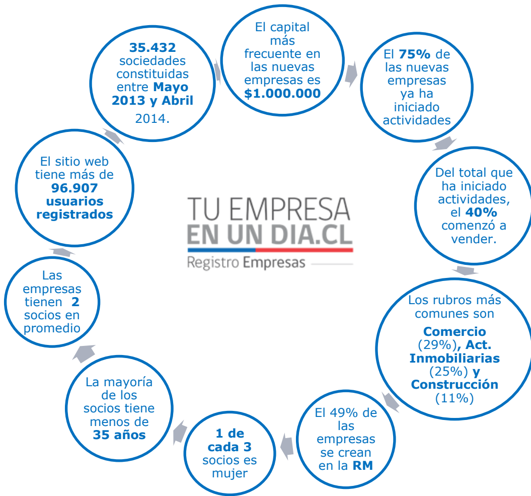
Empresas Constituidas, enero 2007-abril 2014