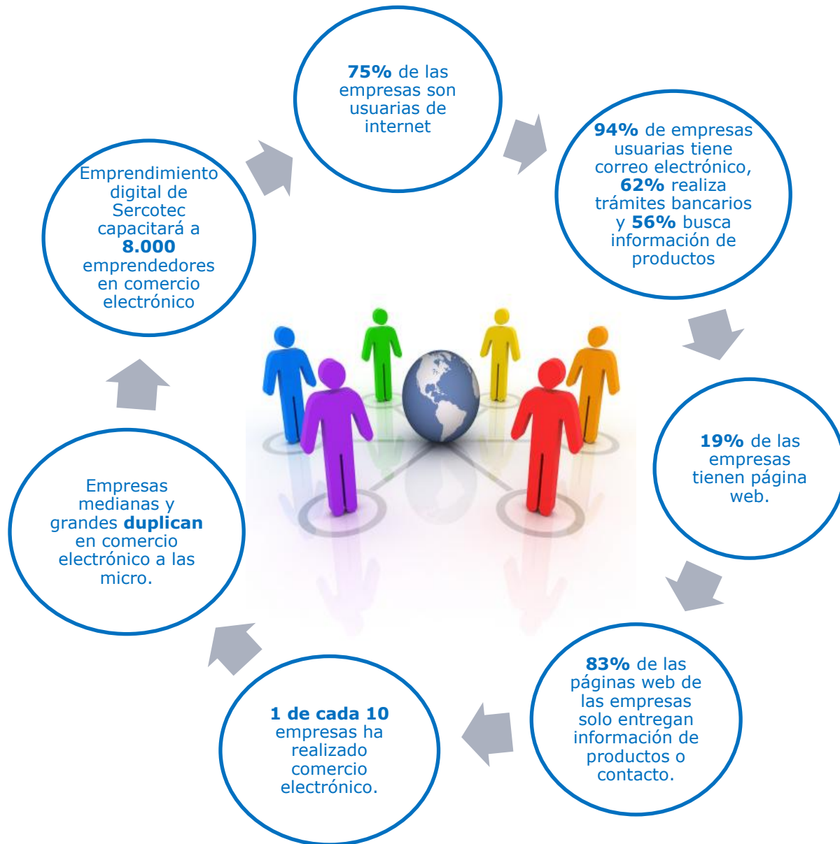
Diagrama del uso de internet en las empresas