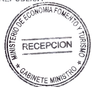
RAMIRO MENDOZA ZUÑIGA CONTRALOR GENERAL DE LA REPÚBLICA

AL SEÑOR PABLO LONGUEIRA MONTES MINISTRO DE ECONOMÍA, FOMENTO Y TURISMO PRESENTE PDO/mvrs.