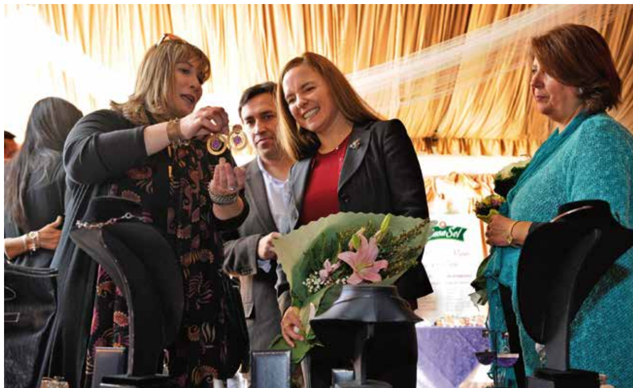
En Rancagua, la subsecretaria de Economía, Katia Trusich, participa en el lanzamiento del Programa Capital Abeja que entrega financiamiento a mujeres emprendedoras.

Adicionalmente, se creó el Consejo de Financiamiento para las Pymes y el Emprendimiento, instancia público-privada compuesta por empresarios y especialistas del ámbito financiero. En 2015 dicho consejo formulará propuestas y recomendaciones para el desarrollo de instrumentos financieros emergentes (como microcrédito, financiamiento colectivo o crowdfunding, entre otros), que permitan democratizar el acceso al crédito. Con ello se dará cumplimiento a la medida 23 de la Agenda de Productividad.