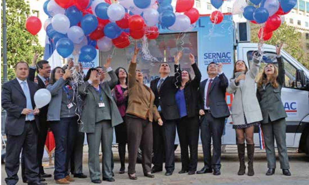
La Presidenta Bachelet encabezó el lanzamiento del programa Sernac en Tu Barrio, que incluye una oficina móvil completamente equipada que atiende reclamos de consumidores de zonas rurales y alejadas.