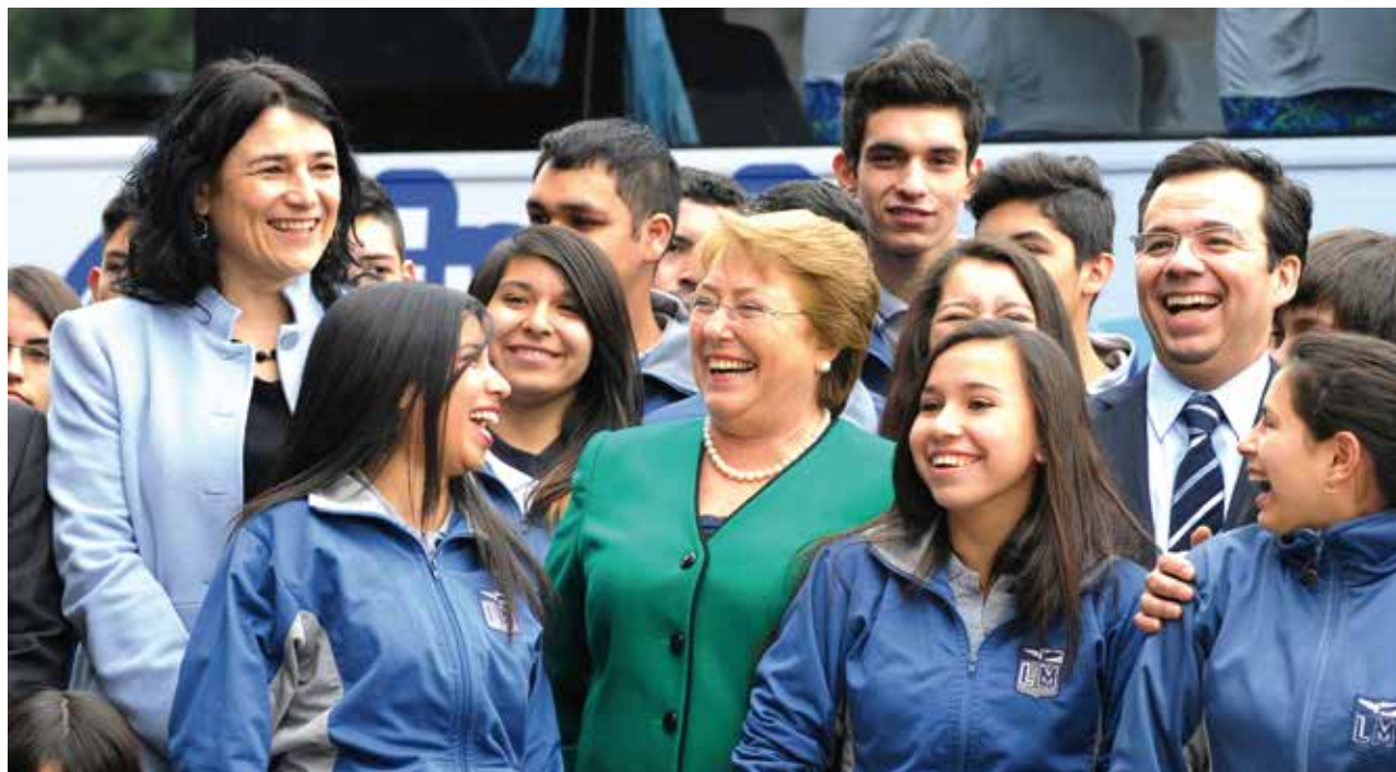
La Presidenta Bachelet, el ministro Céspedes y la subsecretaria de Turismo, Javiara Montes, despiden a alumnos que viajan por Chile gracias al programa de Giras de Estudio.

Durante 2014 se puso en marcha la cuarta temporada del Programa de Vacaciones Tercera Edad, que a julio de este año habrá permitido que 59 mil adultos mayores y personas con capacidad disminuida puedan recorrer nuestro país y disfrutar de sus atractivos turísticos. Este número de beneficiarios es casi