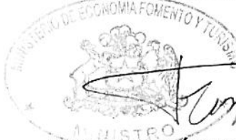
LUIS FELIPE CÉSPEDES CIFUENTES MINISTRO DE ECONOMÍA, FOMENTO Y TURISMO